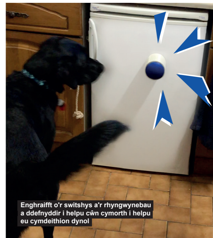
Enghraifft o'r switshys a'r rhyngwynebau a ddefnyddir i helpu cŵn cymorth i helpu eu cymdeithion dynol