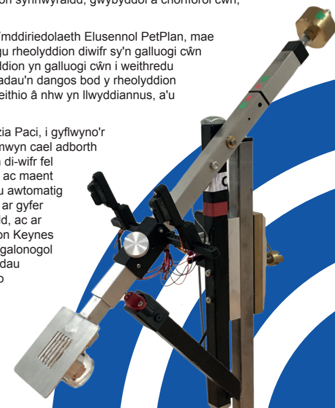
Rhyngwyneb bio-ganfod y gall cŵn ei ddefnyddio i nodi a ydynt wedi canfod clefyd

I gael rhagor o wybodaeth www.open.ac.uk/blogs/ACI